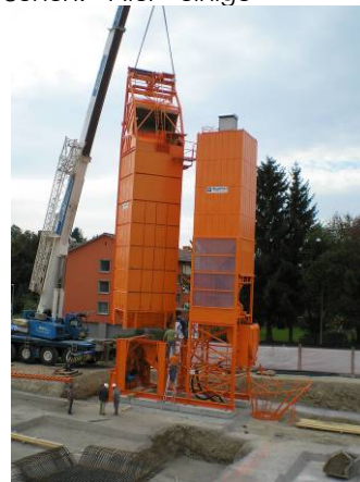
Das Herzstück: die eigene Betonmischmaschine