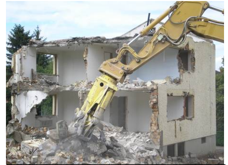
Rückbau der Häuser im Juni 2007