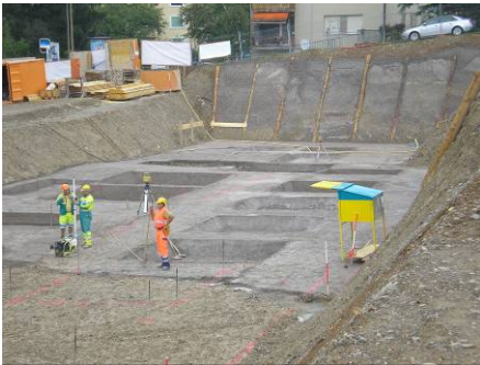
Einbringen der Magerbetonsohle

Seit Mitte April 2007 geht es mit unserem Neubauprojekt in unserer Siedlung Bramenring in Kloten vorwärts. Der Baufortschritt verläuft nach Plan. In diesen Tagen werden das Unter- sowie das Erdgeschoss im Rohbau fertig erstellt sein. Wenn der Winter uns nicht einen grösseren Baustopp aufzwingt, sollte der Bau auf Ende 2008 / Anfangs 2009 bezugsbereit sein. Von den 31 Wohnungen die erstellt werden, haben unsere Genossenschafter bereits 14 Wohnungen reservieren lassen. Die Beschreibung des Neubaus sowie die Vermietungsunterlagen für die Genossenschafter können Sie auf der Homepage www.bramenring.ch sehen. Hier einige Impressionen: