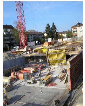
Das Untergeschoss wird betoniert